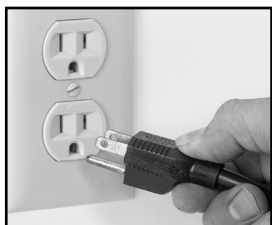
Fig. 4-1 Correct

CET APPAREIL EST FOURNI AVEC UNE FICHE DE MISE À LA TERRE TRIPOLAIRE. LA PRISE DANS LAQUELLE CETTE FICHE EST BRANCHÉE DOIT ÊTRE MISE À LA TERRE. SI LA PRISE NE DISPOSE PAS DU TYPE DE TERRE CORRECT, CONTACTEZ UN ÉLECTRICIEN. NE COUPEZ OU NE RETIREZ JAMAIS LA TROISIÈME BROCHE DE TERRE DU CORDON D'ALIMENTATION ET N'UTILISEZ JAMAIS DE FICHE D'ADAPTATION (Fig. 4-1 et Fig. 4-2).