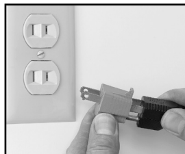
Fig. 4-2 Incorrect